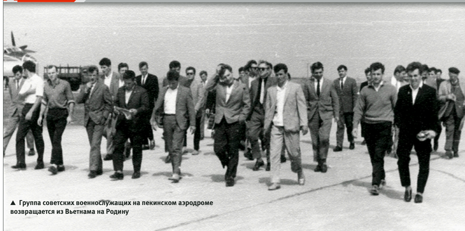
▲ Группа советских военнослужащих на пекинском аэродроме возвращается из Вьетнама на Родину