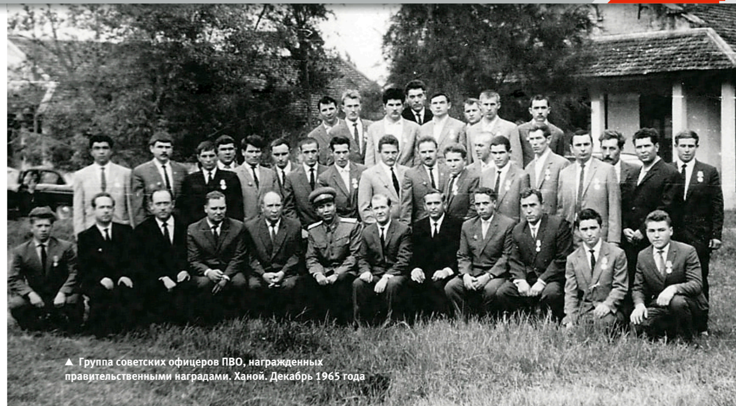
▲ Группа советских офицеров ПВО, награжденных правительственными наградами. Ханой. Декабрь 1965 года

Все встали, отряхнулись, сели в автобус и продолжили путь. Подъехали к глубокому, метров сорок ущелью, на дне которого протекала мутная бурливая река. Через ущелье был переброшен мост. Рядом находилась деревушка. По-